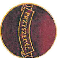
PRZYSZŁOŚĆ KIERUNEK I NADZIEJA