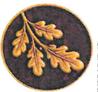
GAŁĄZKI DĘBOWE SIŁA I TRWAŁOŚĆ