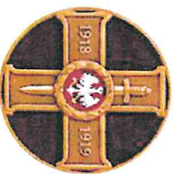
KRZYŻ POWSTAŃCZY 1918-1919