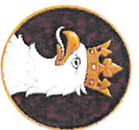
ORZEŁ BIAŁY GODŁO POLSKI